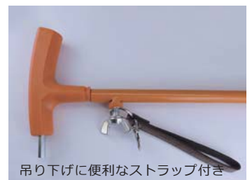
吊り下げに便利なストラップ付き