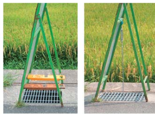
Before → After