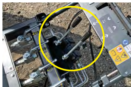
高さ / 傾き調整レバー