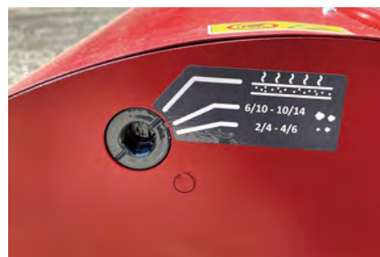
合材 / チップモード切替機能