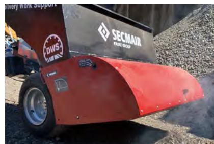
簡易加熱機能 (排気利用) 付きスクリーン