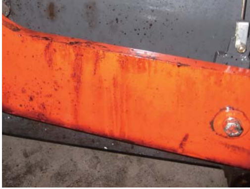
アスファルトフィニッシャ